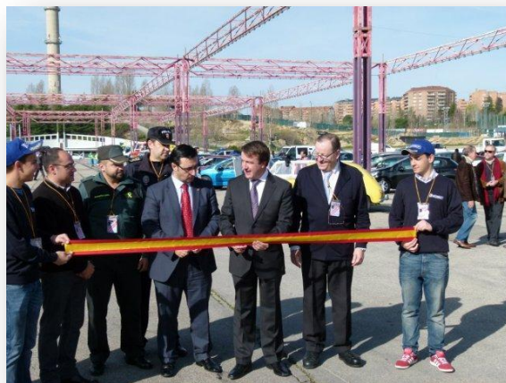
Momento de cortar la cinta

Saludó y se interesó por los concesionarios que expusieron sus vehículos, especialmente con Motor Tres Cantos (Peugeot) y con el Grupo Ginés Bartolomé (Audi, Dacia, Mercedes, Renault, Seat, Smart, Toyota y Volkswagen).