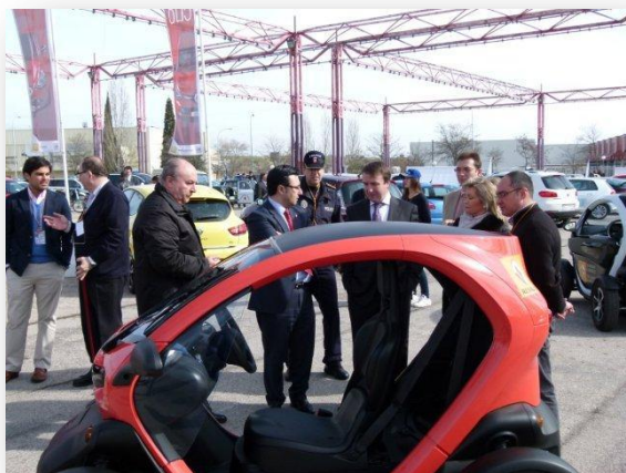
Interesándose por uno de los vehículos eléctricos de Renault