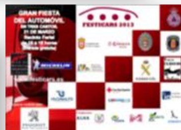
Anuncio de Prensa