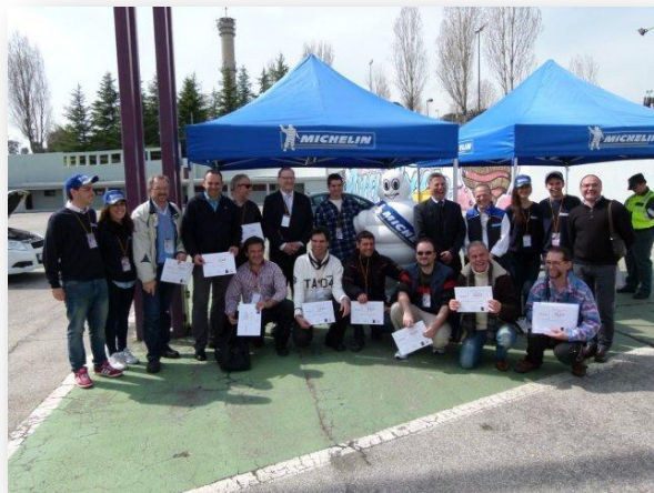
Foto de familia con los diplomas